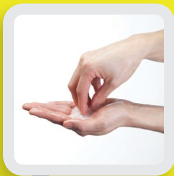
4 NETTOYER LES ONGLES