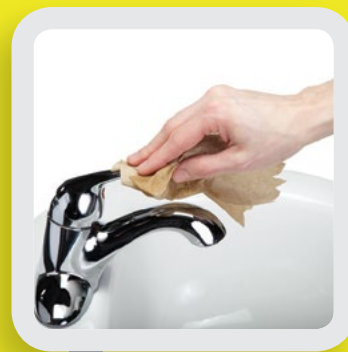
7 FERMER AVEC LE PAPIER